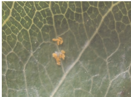
Psila de peral (puesta).