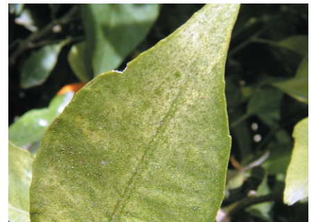
Panonychus citri en hoja.