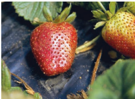
Araña roja en fruto.