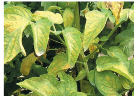
Tetranychus en tomate.