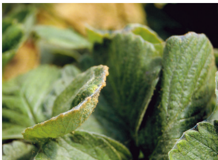
Fresón: síntomas de ataque de araña roja.