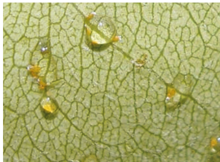
Psila de peral (ninfas protegidas bajo gotas de melaza).