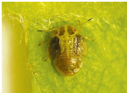
Psila de peral (ninfa de 5º estadio).