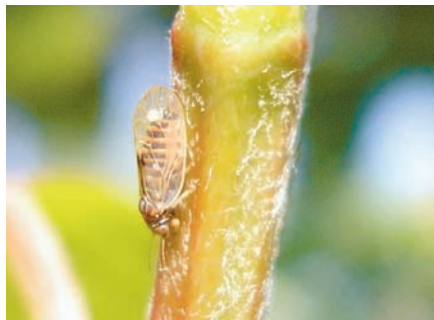
Psila de peral (adulto).