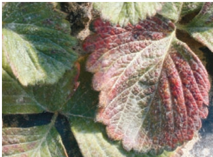
Araña roja en hoja de fresón.