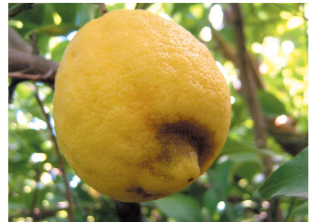
Tetranychus en limón ("bigote").