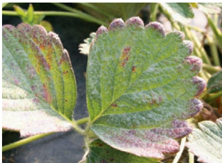
Tetranychus cinnabarinus (araña roja del fresón).