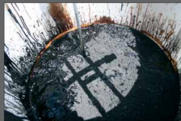
Producto recién incorporado al agua