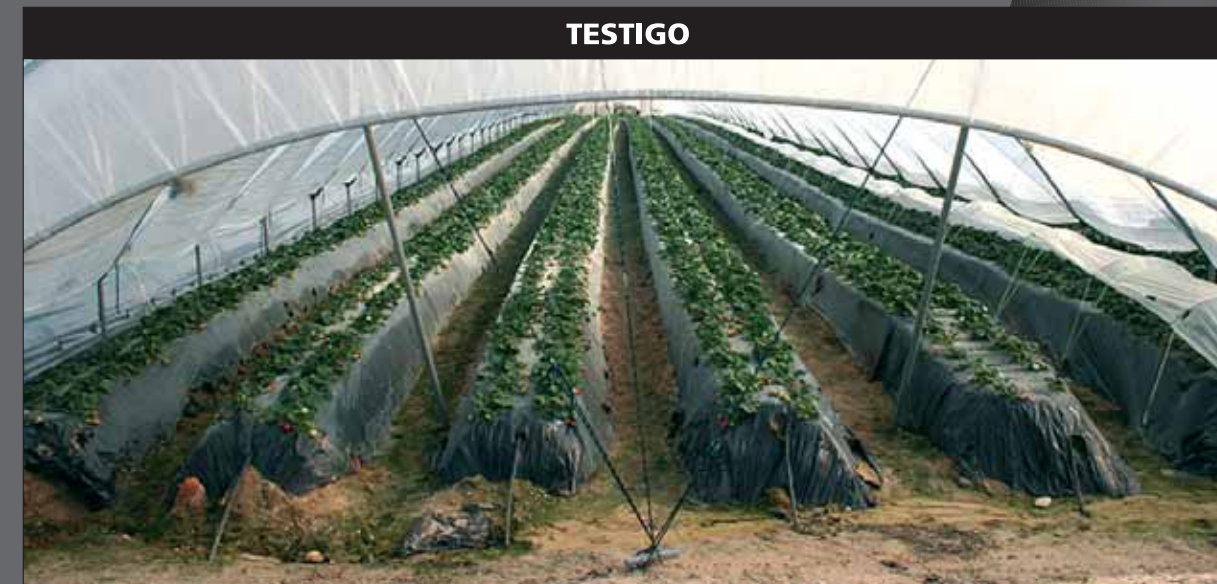
Aspecto del cultivo en lomos del segundo año SIN el tratamiento de GROWEL® .