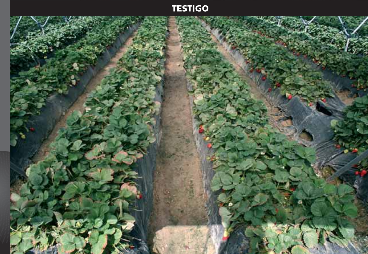
Aspecto del cultivo en lomos del segundo año SIN el tratamiento de GROWEL® , a principios de mayo.