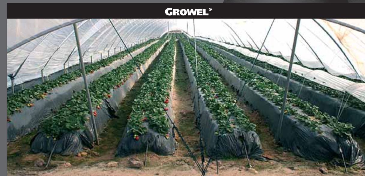
Aspecto del cultivo en lomos del segundo año, a los dos meses del inicio de las aplicaciones (3,4 kg/ha ya aplicados).