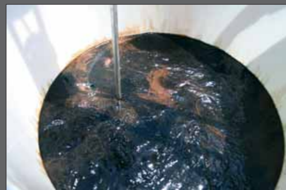
Producto tras la agitación

AUNQUE EL PRODUCTO TIENDE INICIALMENTE A FLOTAR, SE DISUELVE COMPLETAMENTE EN AUSENCIA DE ESPUMA.