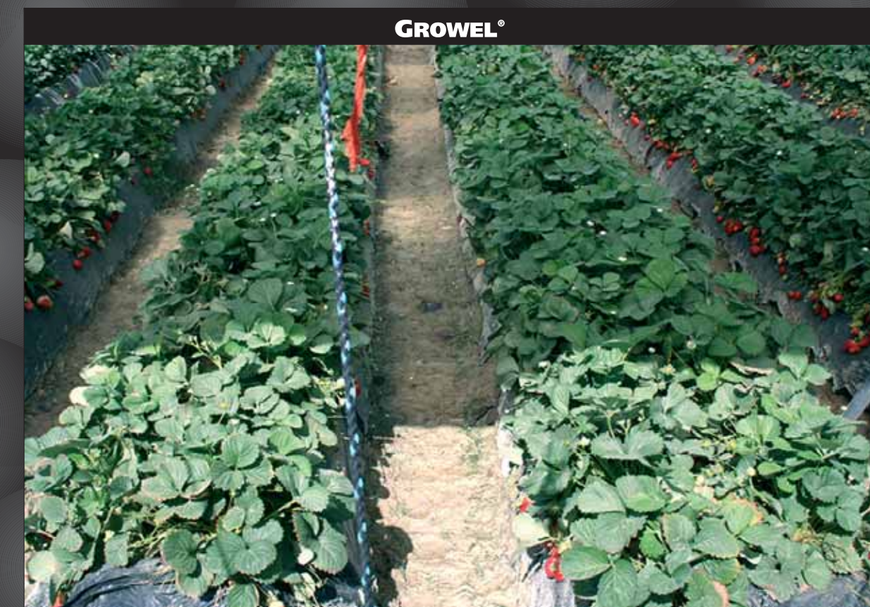
Aspecto del cultivo en lomos del segundo año, a principios de mayo (todo el producto ya aplicado).